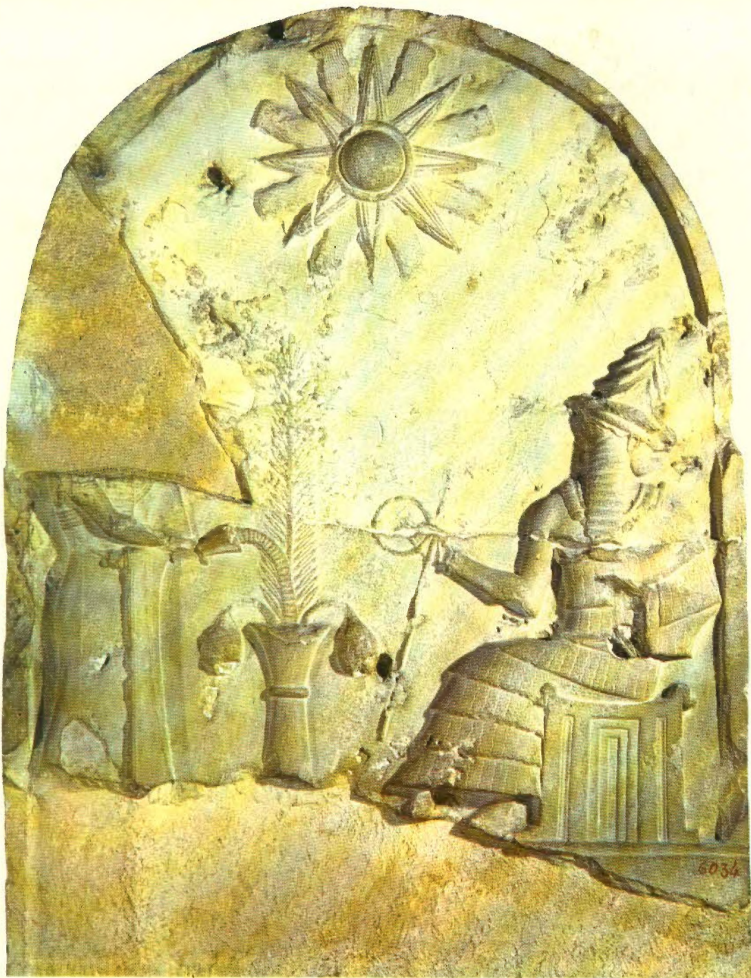
Un monarca de Babilonia hace la libación litúrgica (en un jarro de donde sale un tallo de trigo) ante el dios Shama, sentado en un trono que representa la puerta del santuario (Museo del Louvre, París).

so sabático es de tradición mesopotámica; el mismo nombre Sa-batu es sumerio. Viene de la palabra Sa , que quiere decir corazón, y bat , cesar. Cesar de latir el corazón por las labores diarias, esto quiere decir sábado . Es admirable que los sumerios primitivos reconocieran la necesidad fisiológica del cuerpo humano de trabajar seis días, y el séptimo descansar. Es una fórmula como la que enunció Andrew Carnegie, el rey del acero, cuando dijo que este metal puede doblarse, incluso gana elasticidad doblándolo hasta cierto punto, pero que si se pasa se rompe y no se puede soldar.